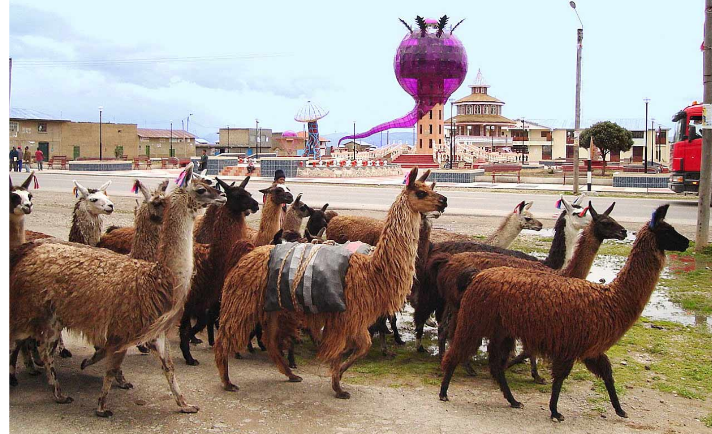
Dos imágenes más de la plaza en Huayre. Costó S/. 600 mil. Es un poblado de 1,800 personas sin desagüe y poca cobertura de agua potable.

En Ancash, el canon minero del gobierno regional se disparó de S/. 3'600,517 hace cuatro años a S/. 63'656,900 en lo que va del 2006. Este año, luego de recuperar su inversión, Antamina sumó su aporte: S/. 480 millones en el periodo junio-diciembre. De esta cantidad, S/. 96 millones van a la gestión regional, S/. 120 millones a la provincial, S/. 48 al distrito, S/. 192 millones a todos los municipios y S/. 5 millones a las universidades públicas. Según el gerente corporativo, Gonzalo Quijandría, en el 2007 los nú-